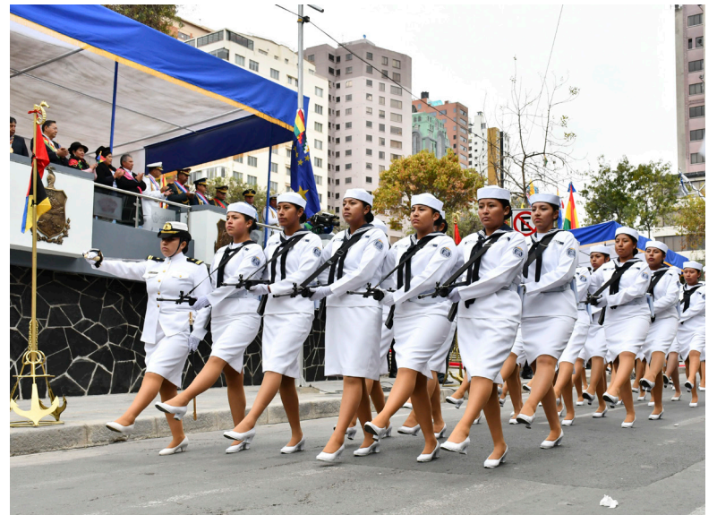
Las FFAA participaron de los actos conmemorativos