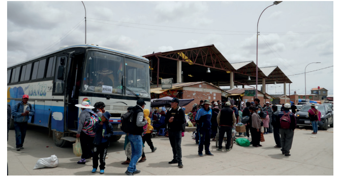
Varios habitantes de Oruro salieron de la ciudad antes del Censo

Durante toda la jornada, el GAMO, a través de sus brazos operativos, cumplió con el Plan de Control por el