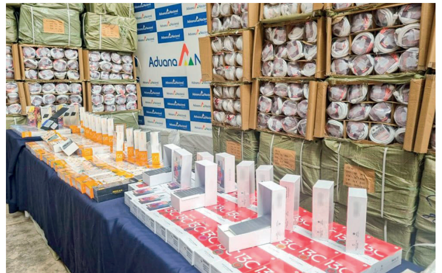
Aduana Nacional requiso mercancía ilegal en Oruro

La autoridad aduanera informó que a pesar de la actitud agresiva de los contrabandistas y las obstaculizaciones sufridas durante los decomisos, se logró llevar a cabo las acciones necesarias para garantizar el cumplimiento de la ley y proteger los intereses del país.