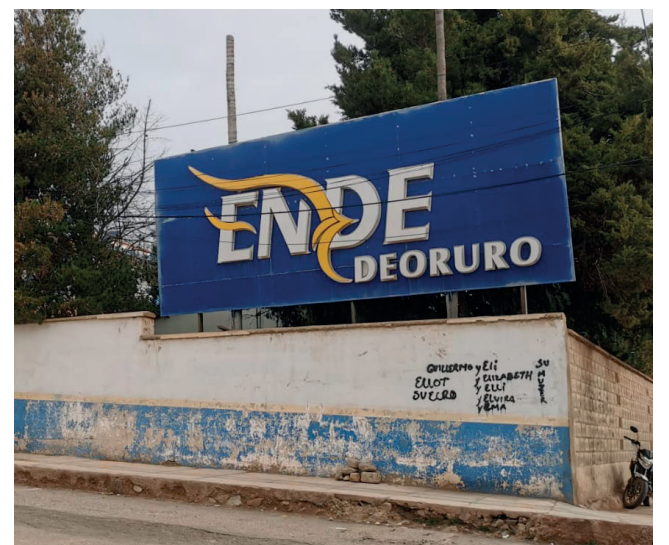
ENDE DeOruro garantizó suministro eléctrico en el departamento

Quispe recomendó que ya desde el lunes, los usuarios con dos facturas vencidas se pongan al día durante las primeras horas de la jornada, para evitar un posterior corte de suministro eléctrico.