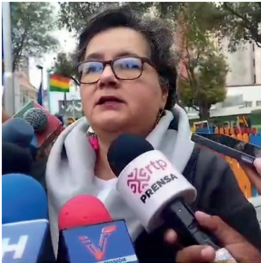
La ministra de Trabajo, Verónica Navia