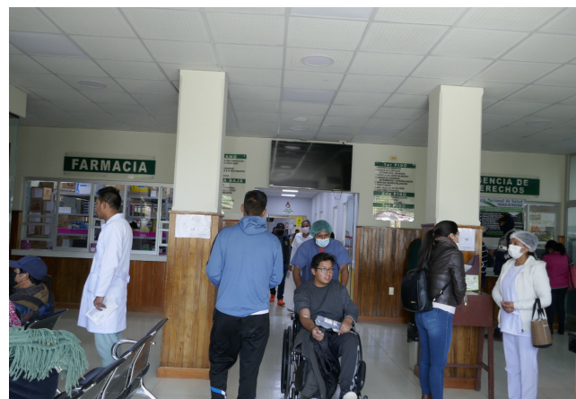
Hospital Obrero atenderá emergencias las 24 horas

El Sedes también aplicará el Plan de Contingencia ante casos de mordedura de perros para resguardar la seguridad de los censistas y brindar una atención inmediata a través de la línea 168, así como los establecimientos de salud que estarán de turno las 24 horas.