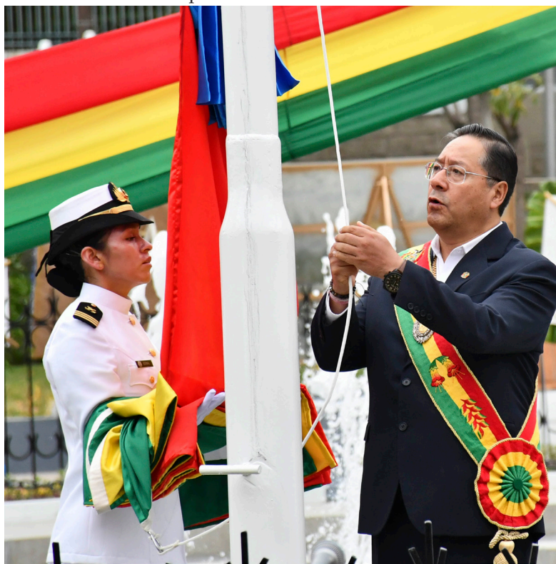
El Presidente durante la iza de la bandera nacional

El mandatario enfatizó que Bolivia no renunciará a su pedido de salida al mar y recordó a los héroes que lucharon durante la guerra del Pacífico.