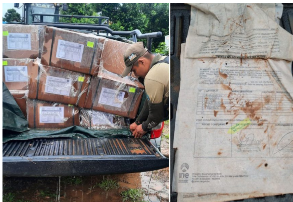
Vehículo del INE con material censal sufre accidente en el Tipnis