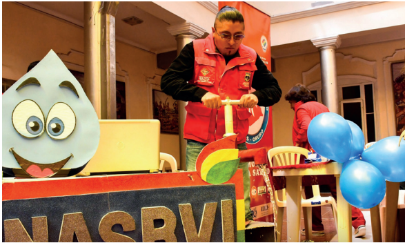
Feria Informativa muestra bondades del agua y su importancia