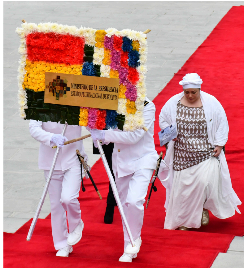
Se entregaron ofrendas florales