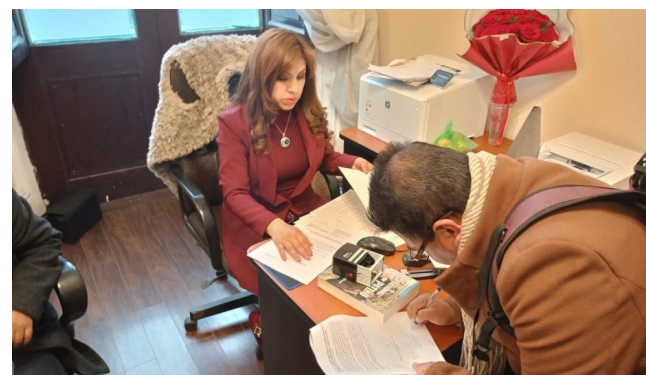
Más de 300 impugnaciones presentadas contra actuales magistrados del Órgano Judicial /CDD

El vocal señaló que, de no darse la impugnación, presentará una acción de amparo constitucional o una acción de inconstitucionalidad y, en caso de ser necesario, acudirá a la Corte Iberoamericana de Derechos Humanos (CIDH).