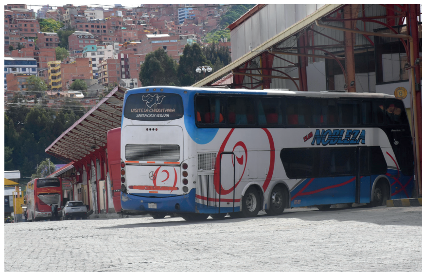
Mucha gente viajó a sus poblaciones para censarse

En cuanto a las cifras relacionadas con el Censo, se espera un aumento poblacional en el departamento, aunque existe la preocupación por la posible pérdida de un escaño parlamentario y posibles impactos económicos. Santos Quispe hizo hincapié en la importancia de aguardar los resultados finales antes