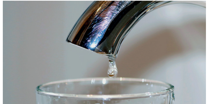
Oruro tiene una producción de agua per cápita de 80 litros por día

Ayer, se conmemoró el Día Mundial del Agua, una fecha para crear conciencia sobre el uso racional del recurso hídrico, si bien en la ciudad de Oruro se tiene garantizado este recurso, en otros municipios e incluso departamentos, se racionaliza por la poca cantidad de líquido.