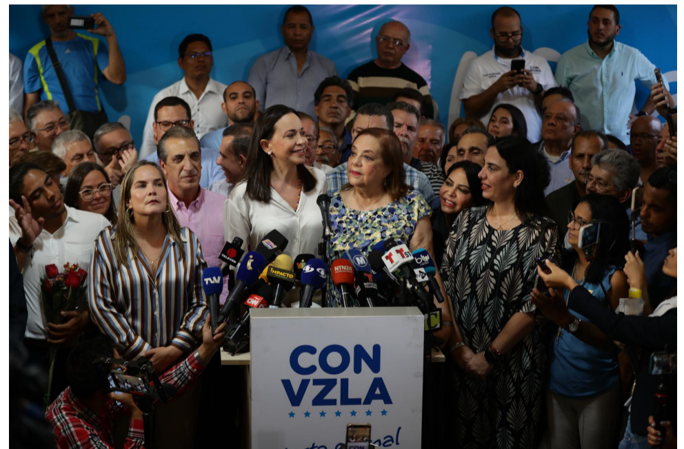
La líder antichavista María Corina Machado (der.) presenta durante una rueda de prensa a la historiadora Corina Yoris (izq.) como candidata para las elecciones presidenciales del próximo 28 de julio, en vista de la inhabilitación que impide competir a la política, hoy en Caracas (Venezuela)

"Encontramos a la persona correcta y (...) es una persona que cuenta con el respeto de todos los que la han conocido a lo largo de